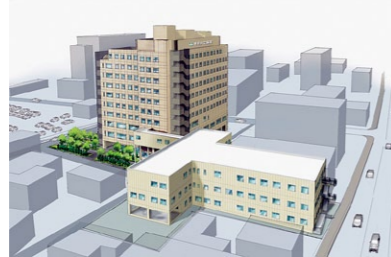
甲府共立病院 新南館 完成予想図 (2014年9月 完成予定)