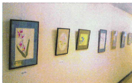
美術の授業での作品展示 5/19