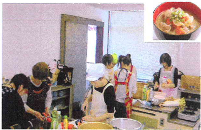
手作り豚汁を作る父母の会の皆様 5/19