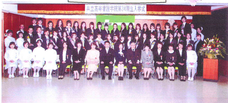
2012年4月5日日本学講堂にて