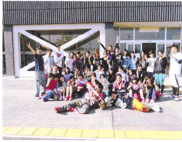
優勝した2年生 5/11 緑ガ丘体育館

5月は1年生から3年生までの全学年が学校に講義で登校しています。この時期を使い球技大会、雑草祭を開催しました。