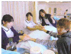
ハンドマッサージ 5/19

今年で35回目を迎えた学院祭「雑草祭」をカリキュラム編成上の事情からこの時期に開催しました。(例年9月)短い準備期間でしたが寸劇、ダンス等のクラス発表、バザー、健康チェック、模擬店、足浴やハンドマッサージ、クラス紹介の展示、美術授業作品展、音楽授業で練習を積んだ合唱発表、受験希望者への学