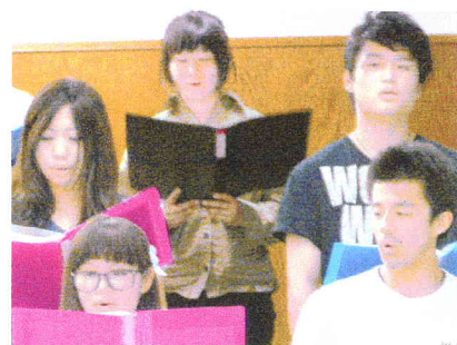
(上: 球技大会 5/11 下: 雑草祭 5/18)