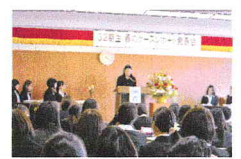
32期生 春のケースレポート発表