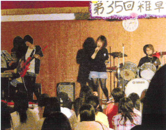
特技披露した雑草祭 5/19 本学講堂