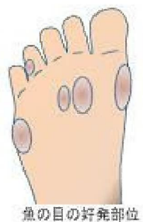
魚の目の好発部位

中心に魚の目のような円錐形の芯が見え、歩く時にこの芯が神経を圧迫して痛みを生じます。